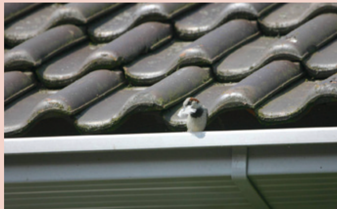
Dak met de Monier Vogelvide