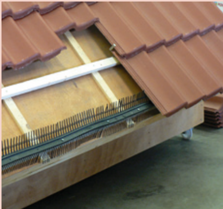
traditioneel dak met vogelschroot