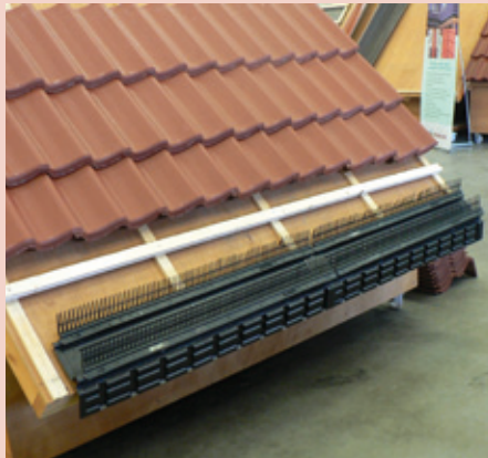
Dakvoet met de Monier Vogelvide