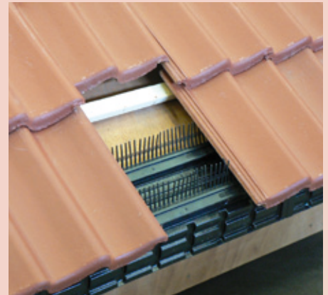
Dakvoet, Monier Vogelvide en pannendek

“Aan een in het tweede tot en met zesde hoofdstuk van het Bouwbesluit 2003 gesteld voorschrift dat moet worden toegepast om te voldoen aan een met betrekking tot een bouwwerk of een gedeelte daarvan gestelde eis, hoeft niet te worden voldaan, voorzover anders dan door toepassing van dat voorschrift het bouwwerk of het betrokken gedeelte daarvan ten minste dezelfde mate van veiligheid, bescherming van de gezondheid, bruikbaarheid, energiezuinigheid en bescherming van het milieu biedt, als is beoogd met het betrokken voorschrift.”